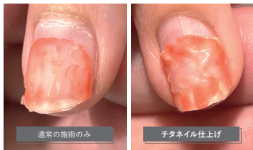
チタネイル仕上げと未使用のオフ時の違い(モニター様ご提供)